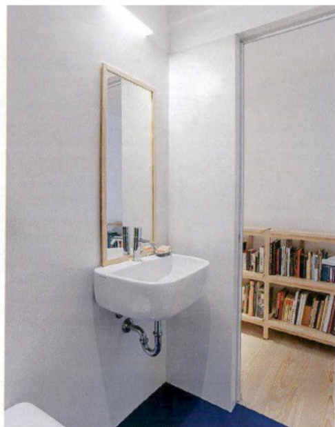
↑ Nel bagno accessibile dal corridoio, il pavimento è rivestito con resina blu di Gobetto . L'appliche sopra lo specchio è di Davide Groppi .

L'appartamento - come si trova allo stato attuale - è stato ricavato dall' accorpamento di due unità immobiliari in precedenza separate, entrambe affacciate sul ballatoio esterno. Per unire i due spazi è bastato demolire un tramezzo in laterizio che si trovava subito a destra dell'attuale ingresso e che non aveva alcuna incidenza sulla statica dell'edificio. Per quanto riguarda il layout, primo obiettivo della ristrutturazione è stato quello di confrontarsi con la particolare forma allungata della pianta, trovando il modo di rendere i passaggi più fluidi e le suddivisioni interne meno rigide e schematiche . Nel corpo principale dell'abitazione la zona giorno ampliata integra la cucina in un blocco servizi centrale di cui fa parte anche l'adiacente bagno; la parte notte con due camere è disimpegnata da un corridoio .